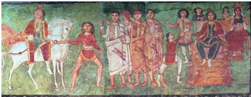
לוח פורים, בית הכנסת של דורא אירופוס (מאה שלישית לספירה)

האם יש בכך כדי לרמוז אודות התקופה בה נכתב הסיפור אודות יוסף?